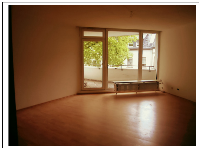
Ihr Blick aus dem Wohnbereich Richtung Terrasse

Die Hauptstraße führt vom Zentrum von Bergisch Gladbach Richtung Osten direkt ins Bergische Land.