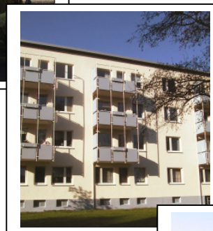
← Ihr Balkon