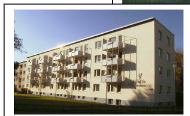
Ihre Süd – West – Ansicht ↑