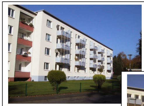
← Ihre Süd – West - Ansicht